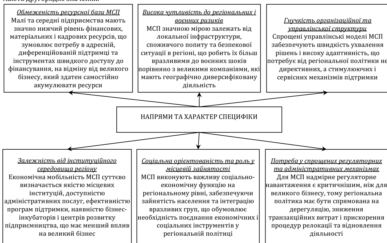
Рис. 2. Особливості предметів регіональної політики забезпечення підвищення економічної мобільності малих і середніх підприємств.

Однією з ключових особливостей є обмеженість ресурсної бази малих і середніх підприємств. Недостатній рівень власного капіталу, обмежений доступ до довгострокового кредитування та залежність від поточних грошових потоків істотно звужують можливості МСП щодо самостійного реагування на кризові та воєнні виклики. У зв'язку з цим регіональна політика, спрямована на підвищення їх економічної мобільності, має передбачати використання адресних фінансових інструментів, спрощених механізмів підтримки та коротких циклів ухвалення рішень. Для великого бізнесу, який здатен акумулювати ресурси на міжрегіональному або міжнародному рівнях, такі інструменти мають другорядне значення.