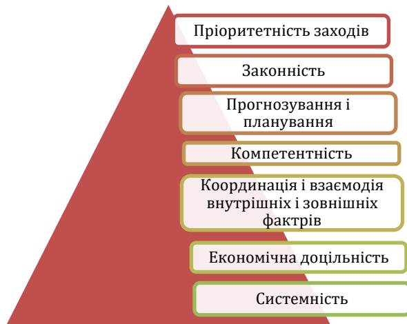
Рис. 2. Принципи побудови системи управління економічною безпекою підприємства

Метою цієї системи може бути мінімізація зовнішніх і внутрішніх загроз для підприємства, зокрема його фінансовим, матеріальним, інформаційним, кадровим ресурсам, на основі розробленого та реалізованого комплексу заходів економіко-правового та організаційно-соціального характеру. Основні завдання системи управління економічною безпекою підприємства наведено на рис. 3.