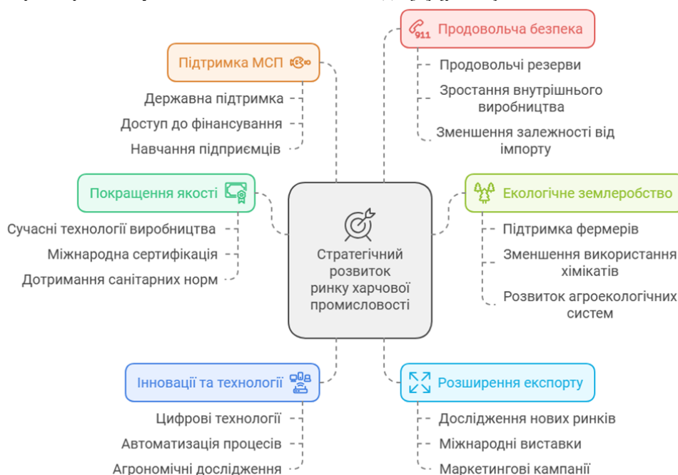
Рис. 2. Стратегічні імперативи розвитку ринку харчової промисловості

У рамках Цілей Сталого Розвитку, адаптованих для України до 2030 року, визначено завдання «Подолання голоду та розвиток сільського господарства». Для досягнення цієї мети необхідно вирішити такі завдання: забезпечення доступності збалансованого харчування для всіх верств населення, підвищення ефективності агропромислового комплексу, створення стійких систем виробництва продовольства та зниження коливань цін на продукти харчування. Для досягнення цих цілей розроблені пріоритетні напрями розвитку та визначені ключові заходи [5] (рис. 2).