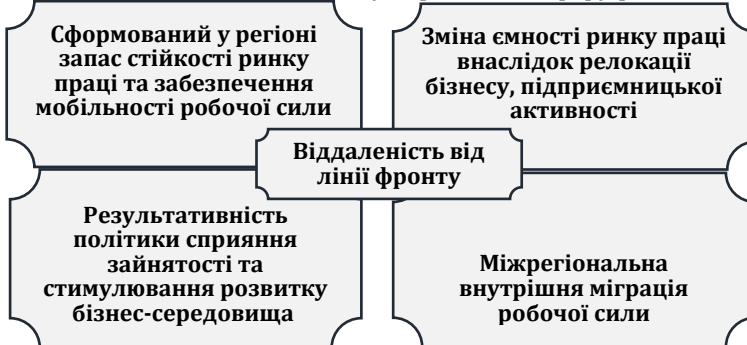
Рис. 1. Фактори забезпечення функціонування регіональних ринків праці в Україні в умовах війни

Свою чергою, нестача працівників з необхідною кваліфікацією створила значний тиск на заробітну плату. На сьогодні зростання рівнів заробітної плати відбулося як у бюджетному, так і у приватному секторах, однак згідно з проведеними експертними опитуваннями [2] за станом на кінець літа 2024 р. більшість підприємств не збільшувала кількість працівників, а деякі навіть її скоротила, зокрема будівельні підприємства. Такі скорочення не є бажаними, скоріше вимушеними обставинами, оскільки значна частка підприємств водночас страждає на нестачу кадрів, причинами якої є не тільки міграція, але й мобілізація їхніх працівників до лав ЗСУ. Серед галузей, у яких дефіцит кадрів є найбільш відчутним, можемо виокремити роздрібну торгівлю та сферу робітничих спеціальностей.