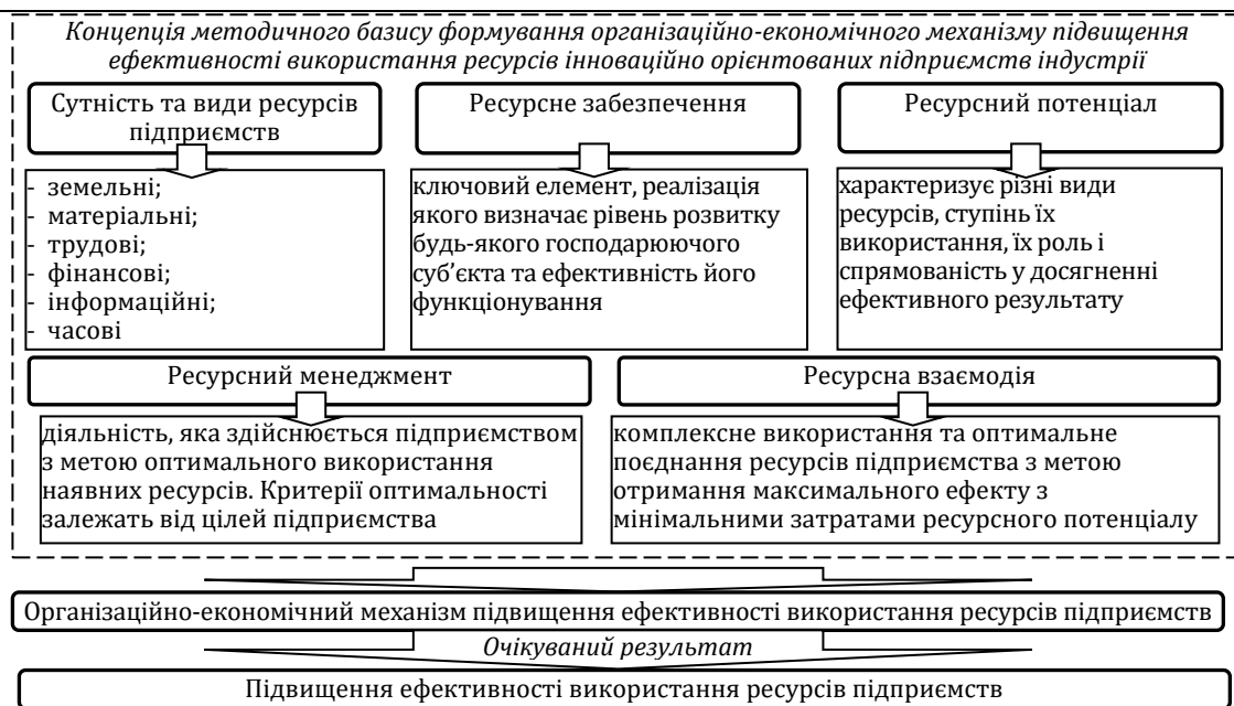
Рис. 1. Концепція методичного базису формування організаційно-економічного механізму підвищення ефективності використання ресурсів інноваційно орієнтованих підприємств індустрії гостинності