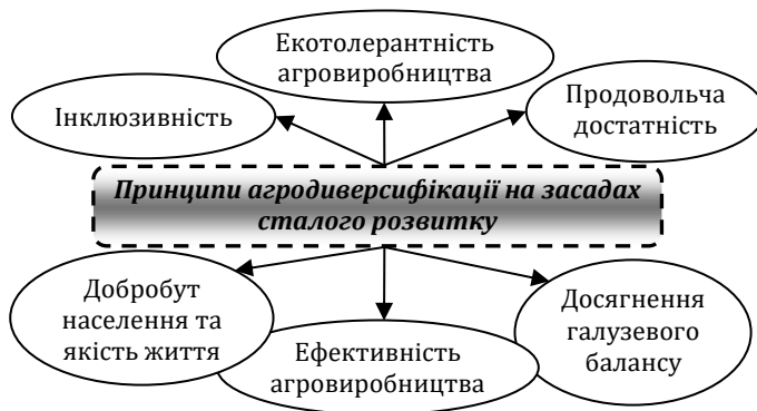
Рис. 3. Базові принципи диверсифікації діяльності бізнес-суб'єктів аграрного сектору на засадах сталості

Проведені дослідження дозволили визначити, що диверсифікація господарської діяльності бізнес-суб'єктів аграрного сектору є важливим інструментом стратегічного розвитку і здобуття економічних вигід. За умов імплементації засад концепції сталого розвитку роль і значення диверсифікації аграрного бізнесу значно зростає. Диверсифікація діяльності агропідприємств формує передумови для отримання не лише економічних бонусів та зниження рівня ризикованості господарювання. За умов переходу на довгострокові цінності сталого розвитку диверсифікація є інструментом вирішення складних виробничих, соціальних та екологічних проблем сільського господарства і сільських територій. Потенціал диверсифікації аграрного бізнесу визначає можливості зміцнення продовольчої безпеки, досягнення кліматичної сталості і збереження природних і біоресурсів агросфери, визначає потенціал розв'язання завдань інклюзивного розвитку сільського господарства і сільських територій. Для цього диверсифікація агробізнесу має здійснюватися на принципах екологічності агровиробництва, продовольчої достатності, інклюзивності, досягнення галузевого балансу агровиробництва, ефективності, підвищення рівня добробуту та якості населення країни. Перспективами подальших наукових пошуків в обраному контексті постає вибір та обґрунтування форм і напрямів диверсифікації господарської діяльності аграрних бізнес-суб'єктів з урахуванням пріоритетів і цінностей сталого розвитку.