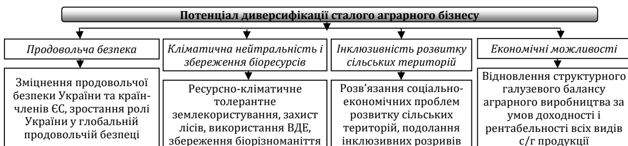
Рис. 1. Складові потенціалу диверсифікації господарської діяльності аграрних бізнес-суб'єктів на засадах сталого розвитку.

Вирішення цих основних завдань і практична реалізація потенціалу диверсифікації діяльності агропідприємств має забезпечуватись на принципах і цінностях сталого розвитку, цілі якого постають пріоритетними для світової спільноти та України. За такого підходу у ролі основних елементів потенціалу диверсифікації сталого аграрного бізнесу можна виділити такі: продовольча безпека, кліматична нейтральність і збереження біоресурсів, інклюзивність розвитку сільських територій, економічні можливості (рис. 1).