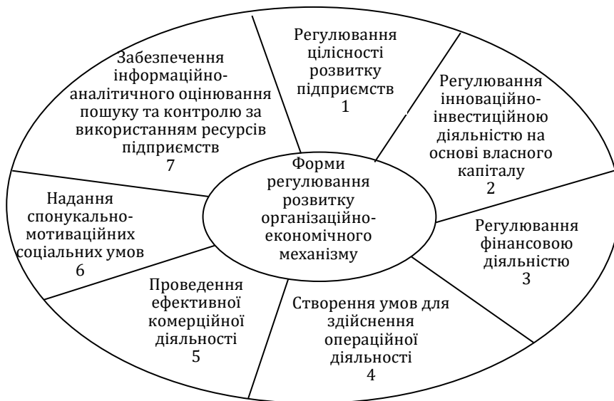
Рис. 2. Основні складові організаційно-економічного регулювання діяльності та розвитку плодово-овочевого консервного виробництва

сировини, їх випереджальний розвиток, порівняно з потребами споживачів, що дозволить знизити вплив сезонності на задоволення перспективного попиту;