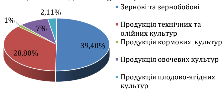
Рис. 2. Структура диверсифікації галузі рослинництва агропідприємств України, %

тур – з 18,1% до 28,8%, зменшилась частка кормовиробництва, овочевих і плодово-ягідних культур. 2021 р. структура фактичного стану диверсифікації виробництва продукції рослинництва виглядала так (рис. 2).