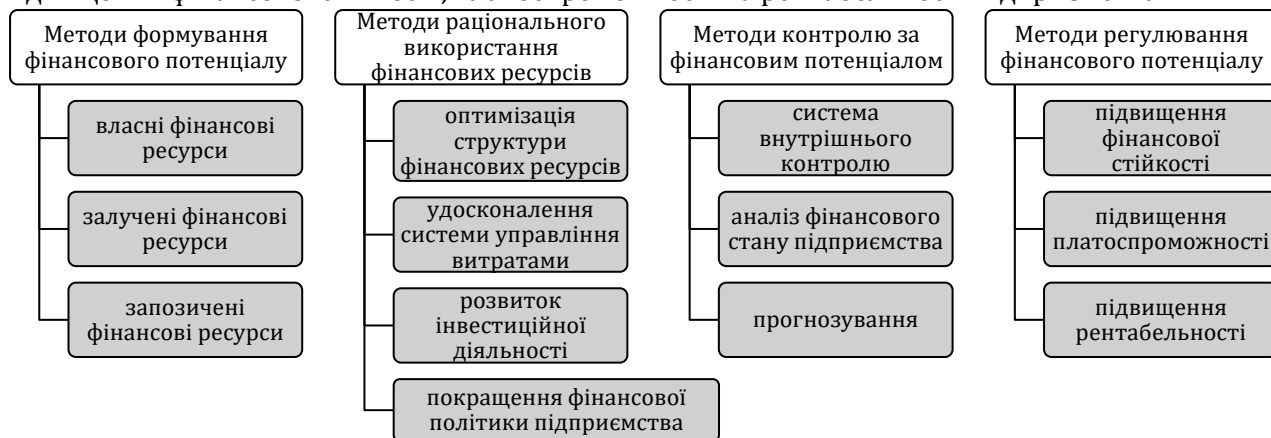
Рис. 2. Методи управління фінансовим потенціалом підприємства

емством і вкладення фінансових ресурсів у розвиток підприємства, що дозволяє підвищити його конкурентоспроможність. Доцільно розробляти та реалізовувати заходи, які спрямовані на підвищення фінансової стійкості, платоспроможності та рентабельності підприємства.