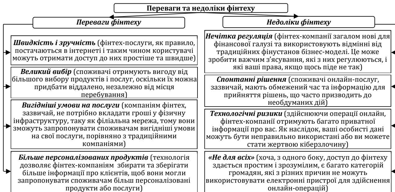
Рис. 1. Переваги та недоліки фінтеху. (Джерело: сформовано на основі [5]).

Потенційні переваги фінтеху очевидні, однак у фінтеху є і певні недоліки (рис. 1).