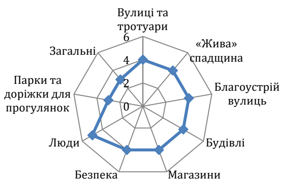
Рис. 4. Кількісна оцінка розширеного туристичного продукту м. Новомосковська

На рис. 4 візуально зображено кількісну оцінку розширеного туристичного продукту м. Новомосковська. Визначено, що найважливішим пріоритетом для в'їзного туризму до м. Новомосковська є вдосконалення факторів «Інституційна структура»: транспортні комунікації, готельна індустрія, громадське харчування, мережі туроператорів і турагентств, екскурсійні послуги, об'єкти ділового та спортивного призначення.