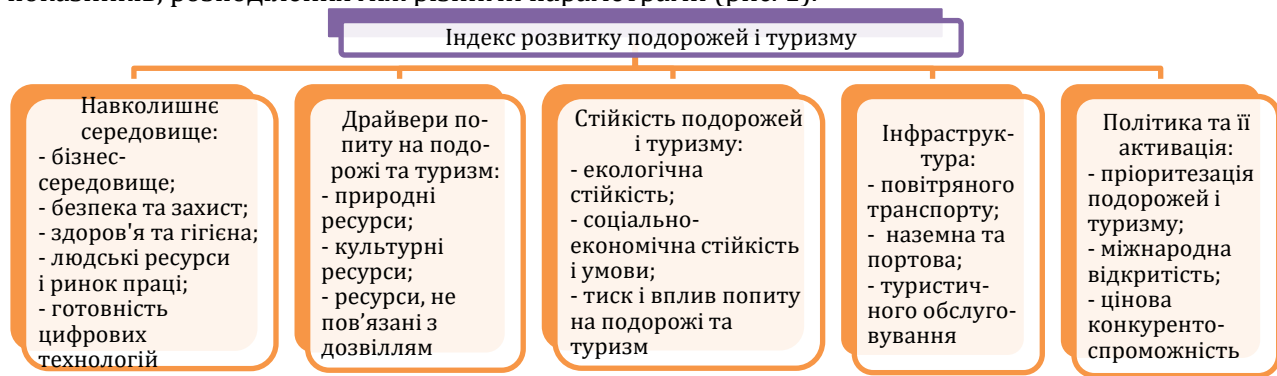
Рис. 1. Індекс розвитку подорожей і туризму

Для оцінювання туристичного потенціалу регіону та визначення його основних факторів і складових за основу взято параметри Індексу розвитку подорожей і туризму [13]. Індекс складається з п'яти субіндексів, 17 параметрів туристичної привабливості та 112 окремих показників, розподілених між різними параметрами (рис. 1).