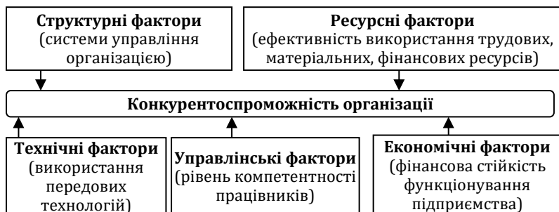
Рис. 1. Внутрішні фактори конкурентоспроможності підприємства

Стратегія – це загальна спрямованість певної діяльності з урахуванням потреби в ній, умов та можливостей для її здійснення. Здійснення стратегії підвищення конкурентоспроможності дозволить організації адаптуватися до зовнішніх умов нестабільності, її економічна система стане більш стійкою, а отже, сприятиме зміцненню її економічної безпеки.