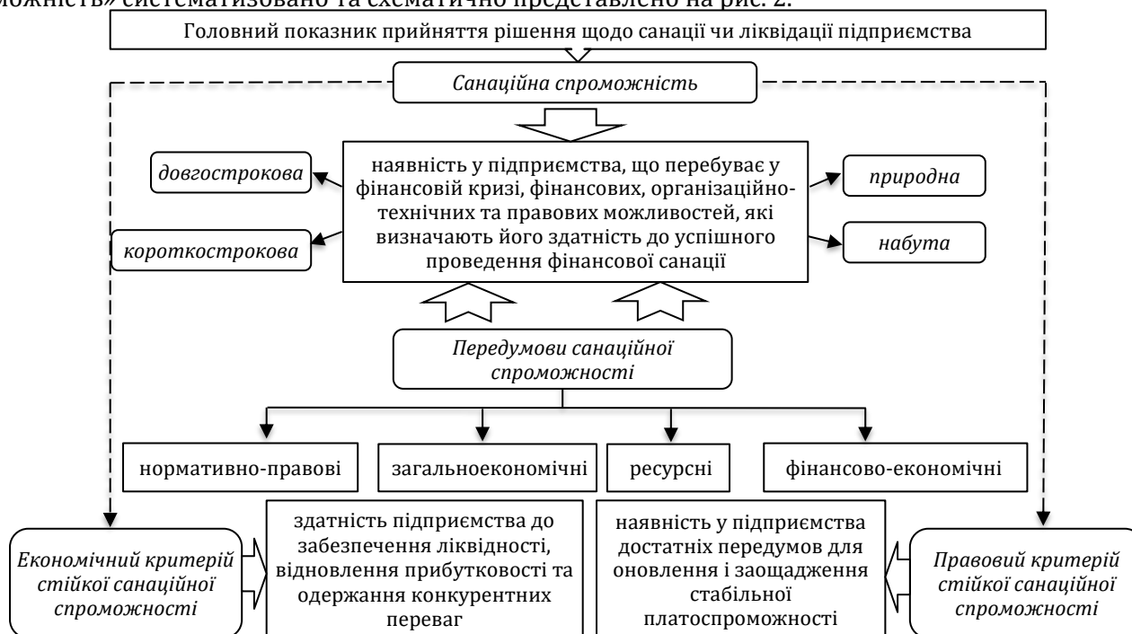
Рис. 2. Сутність поняття «санаційна спроможність» підприємства

У результаті аналізу вищенаведеного матеріалу сутність поняття «санаційна спроможність» систематизовано та схематично представлено на рис. 2.