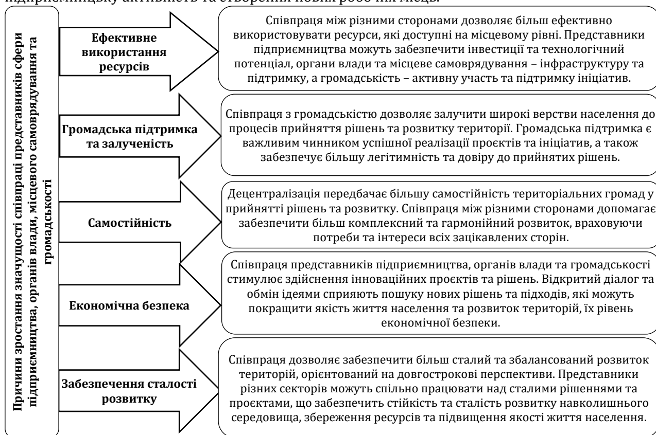
Рис. 1. Причини зростання значущості співпраці представників сфери підприємництва, органів влади, місцевого самоврядування та громадськості в умовах децентралізації

Співпраця бізнесу з органами влади дозволяє створювати сприятливе бізнес-середовище, вирішувати питання земельних прав, інфраструктури, підтримки малого та середнього підприємництва. Така взаємодія сприяє залученню інвестицій у розвиток територій, стимулює підприємницьку активність та створення нових робочих місць.