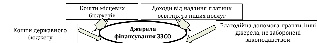
Рис. 1. Джерела фінансування закладів загальної середньої освіти в Україні

Конституцією України гарантується доступність і безоплатність повної загальної середньої освіти, а згідно з Законом України «Про повну загальну середню освіту» рівний доступ до її здобуття «забезпечується шляхом фінансування закладів освіти за рахунок коштів державного та місцевих бюджетів в обсязі, достатньому для виконання державних стандартів та ліцензійних умов» [6]. Законодавством визначено широкий перелік джерел фінансування закладів загальної середньої освіти (ЗЗСО) (рис. 1).