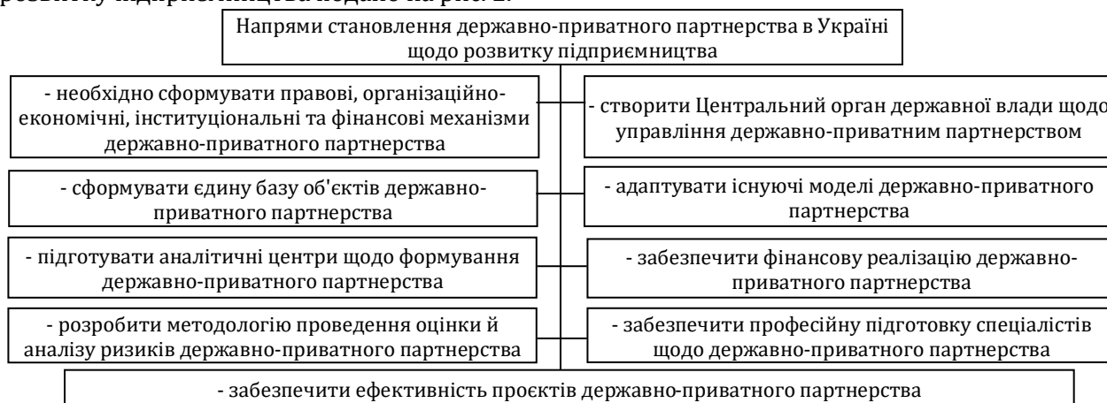
Рис. 2. Основні напрями становлення державно-приватного партнерства в Україні щодо розвитку підприємництва (розробка авторів)

Основні напрями становлення державно-приватного партнерства в Україні щодо розвитку підприємництва подано на рис. 2.