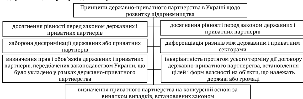
Рис. 1. Основні принципи державно-приватного партнерства України щодо розвитку підприємництва (сформовано авторами на основі [3, 5])

Основні принципи державно-приватного партнерства України щодо розвитку підприємництва [3, 5] подано на рис. 1.