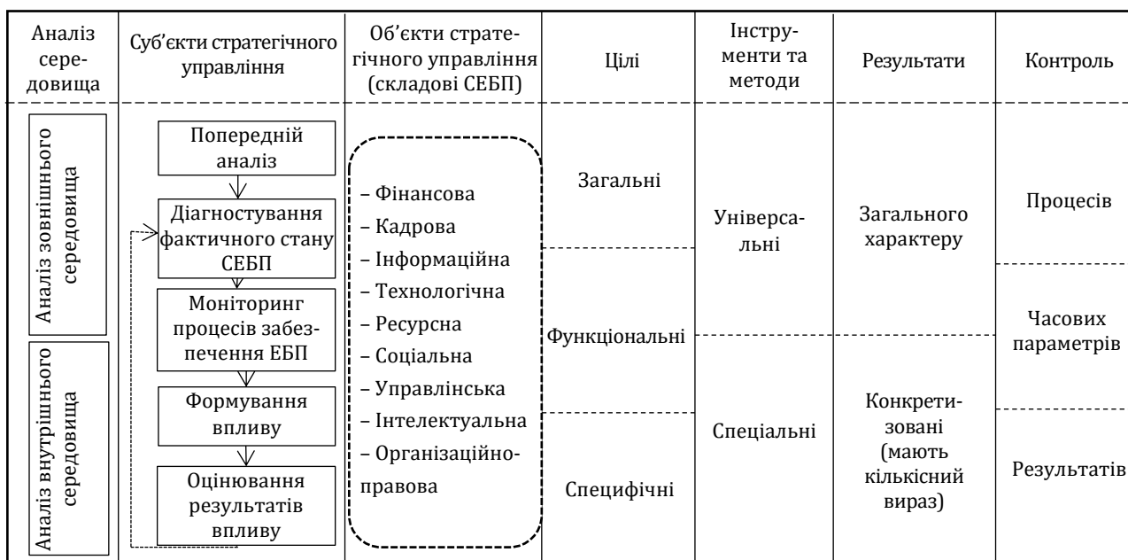
Рис. 2. Архітектура механізму реалізації стратегії забезпечення економічної безпеки підприємства

Враховуючи вищезазначене, основними суб'єктами, які будуть ініціювати запуск та функціонування відповідного механізму за рахунок прийняття управлінських рішень, будуть: власники компанії, менеджмент компанії, працівники служби економічної безпеки підприємства. З урахуванням вищенаведених особливостей представимо архітектуру механізму реалізації стратегії забезпечення економічної безпеки підприємства (рис. 2). Такий механізм включає сім основних елементів з відповідним їх наповненням в залежності від особливостей самого підприємства та інституційного середовища його функціонування.