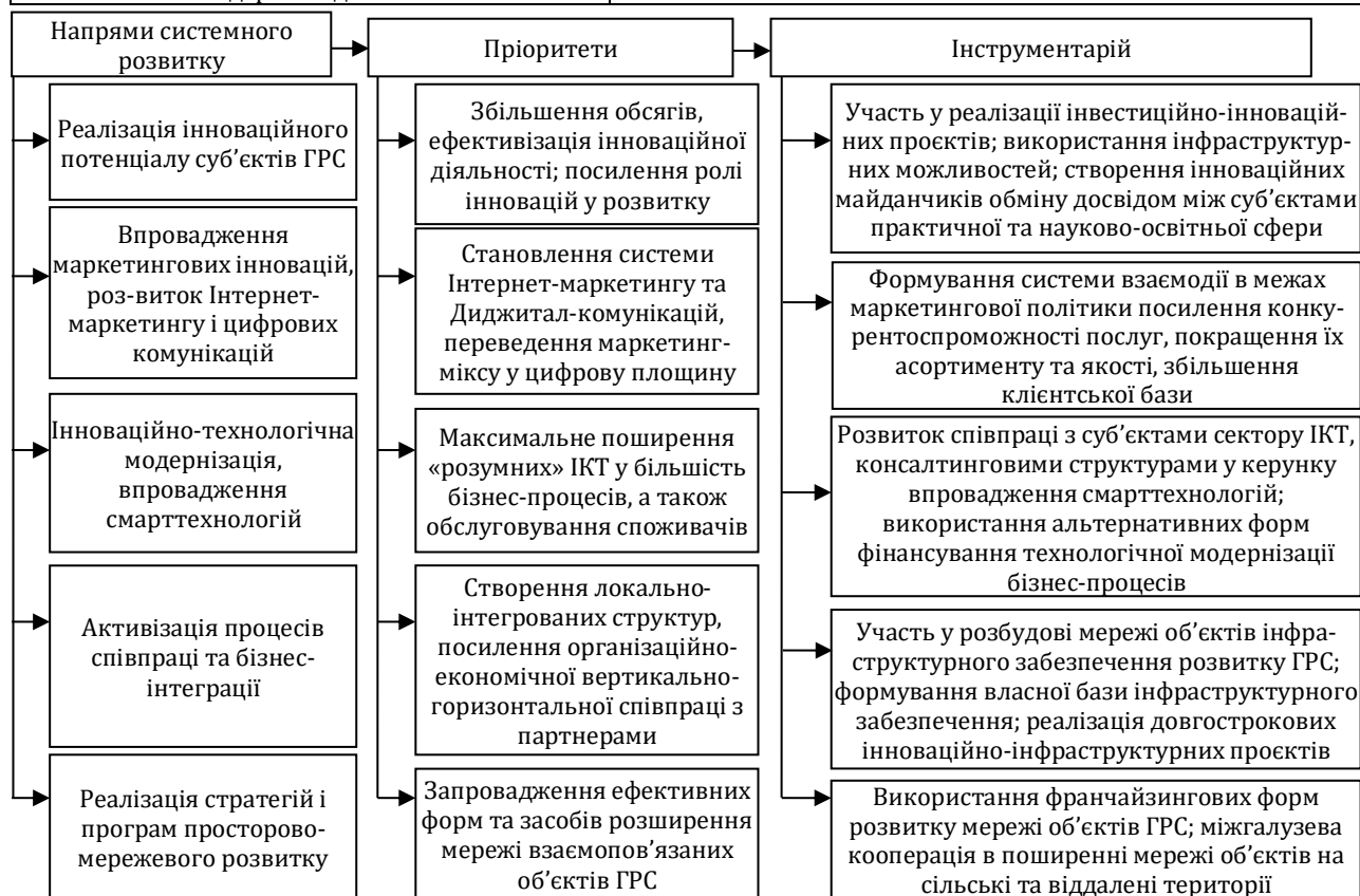
Рис. 2. Пріоритетні вектори, напрями та інструментарій забезпечення розвитку й ефективізації діяльності суб'єктів індустрії гостинності на прикладі підприємств готельно-ресторанного бізнесу