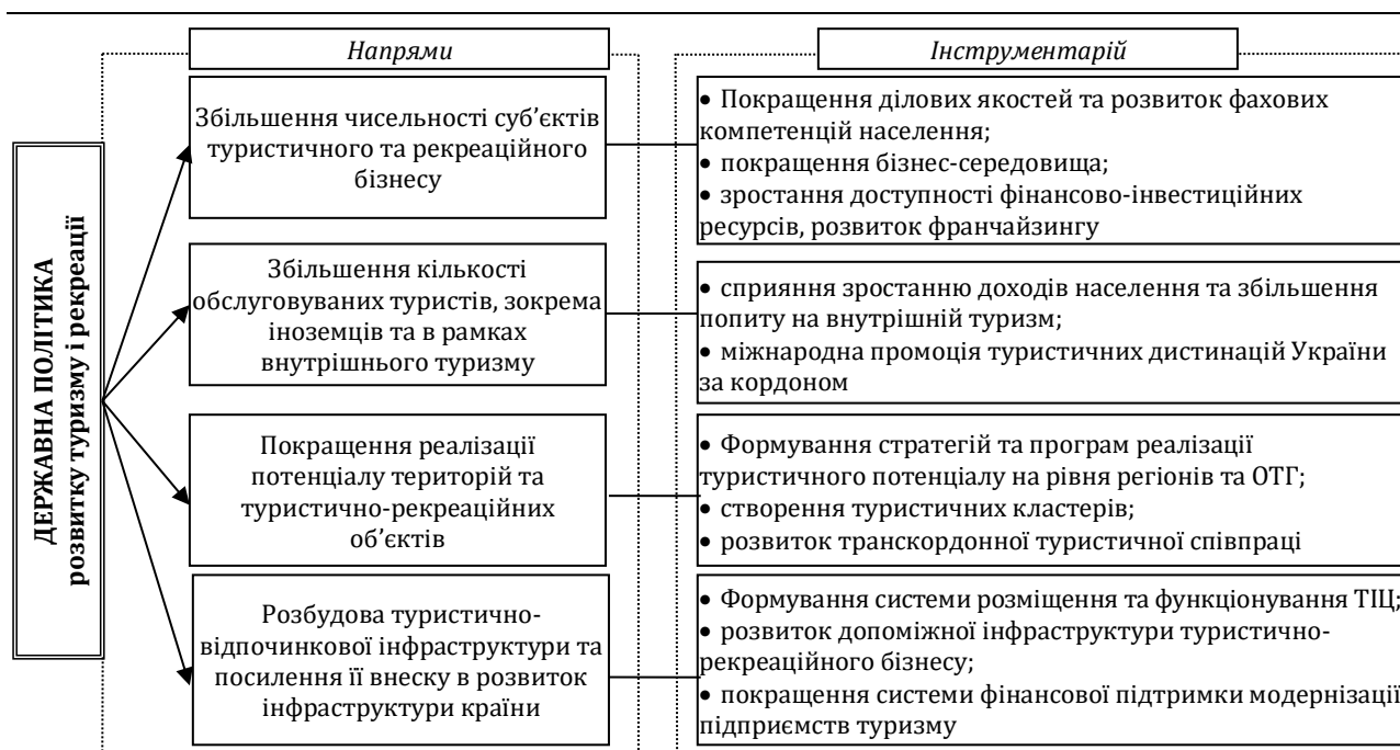
Рис. 2. Напрями та інструментарій державної політики розвитку туризму і рекреації в Україні (авторська розробка)

З урахуванням усіх особливостей діяльності пріоритетними напрямами розвитку туризму і рекреації в регіонах України мають стати підвищення ефективності управління іміджем, впровадження маркетингових підходів, формування туристичних потоків на засадах логістики, розвиток та ефективне використання інтелектуально-кадрового місцевого ресурсу, формування та запровадження партнерських відносин, підвищення рівня якості туристичних послуг.