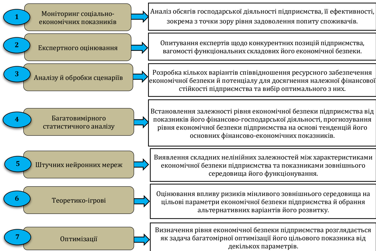
Рис. 3. Характеристика методів оцінювання економічної безпеки підприємств, які мають стратегічне значення для економіки і безпеки держави

*систематизовано автором [1-3; 5-7; 10; 13; 16; 17; 22]