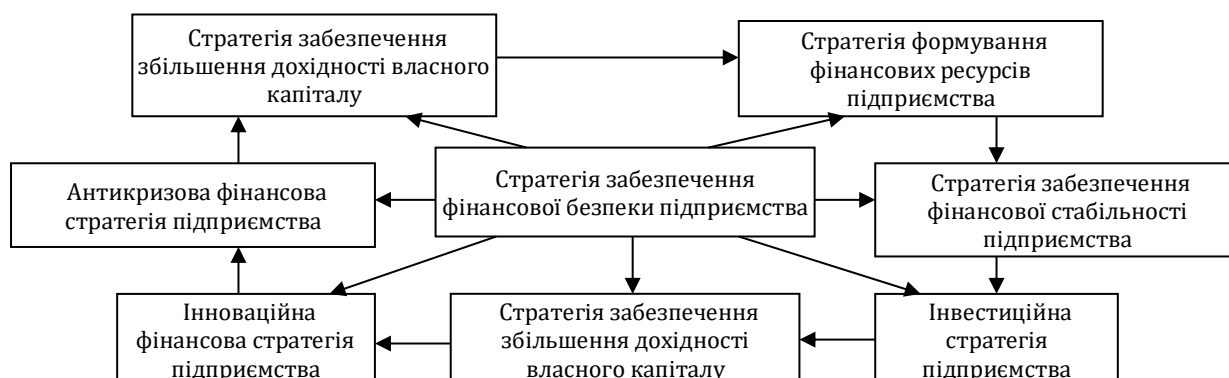
Рис. 1. Домінуючі сфери (напрями) та послідовність формування загальної фінансової стратегії забезпечення економічної безпеки підприємства

Стратегія забезпечення фінансової безпеки підприємства є одним з видів його функціональної стратегії, що забезпечує захист фінансових інтересів від різноманітних загроз шляхом формування довгострокових цілей захисту, обрання найбільш ефективних шляхів їх досягнення, адекватного коригування напрямів та форм захисту при зміні факторів і умов фінансового середовища функціонування. З урахуванням цього в системі загальної стратегії забезпечення економічної безпеки підприємства доцільно виділяти такі домінуючі її сфери (рис. 1).