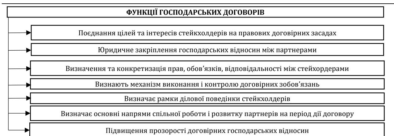
Рис. 1. Функції господарських договорів