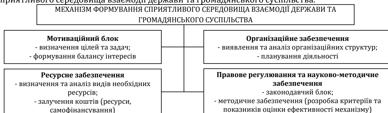
Рис. 3. Схема структурних складових механізму формування сприятливого середовища взаємодії держави та громадянського суспільства

На рис. 3 представлена схема структурних складових механізму формування сприятливого середовища взаємодії держави та громадянського суспільства.