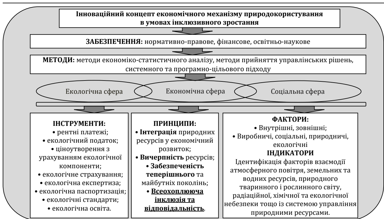
Рис. 3. Схема інноваційного концепту економічного механізму природокористування в умовах інклюзивного зростання

До сукупності інструментів економічного механізму природокористування слід відносити: різні форми рентних відносин (капіталізація, корпоратизація, диверсифікація тощо), екологічний податок, ціноутворення з урахуванням екологічної компоненти, екологічне страхування, екологічну експертизу програм розвитку та проєктів, екологічну паспортизацію, екологічні стандарти, ліцензування можливостей природокористування, екологічні інновації, екологічну освіту.