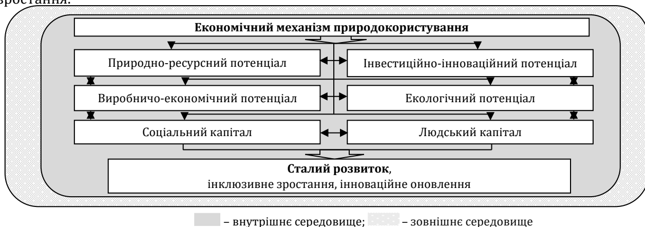
Рис. 2. Модель формування економічного механізму природокористування в умовах інклюзивного зростання

В контексті забезпечення виконання Цілей сталого розвитку [10] інклюзивне зростання національної економіки можливо забезпечити за рахунок розширення можливостей економічної свободи та економічної співучасті. Проте слід зазначити, що в сучасних кризових умовах для України важко визначити чіткі часові межі для періодів відновлення та економічного зростання. Але період відновлення однозначно пов'язаний із розробкою заходів економічного зростання.