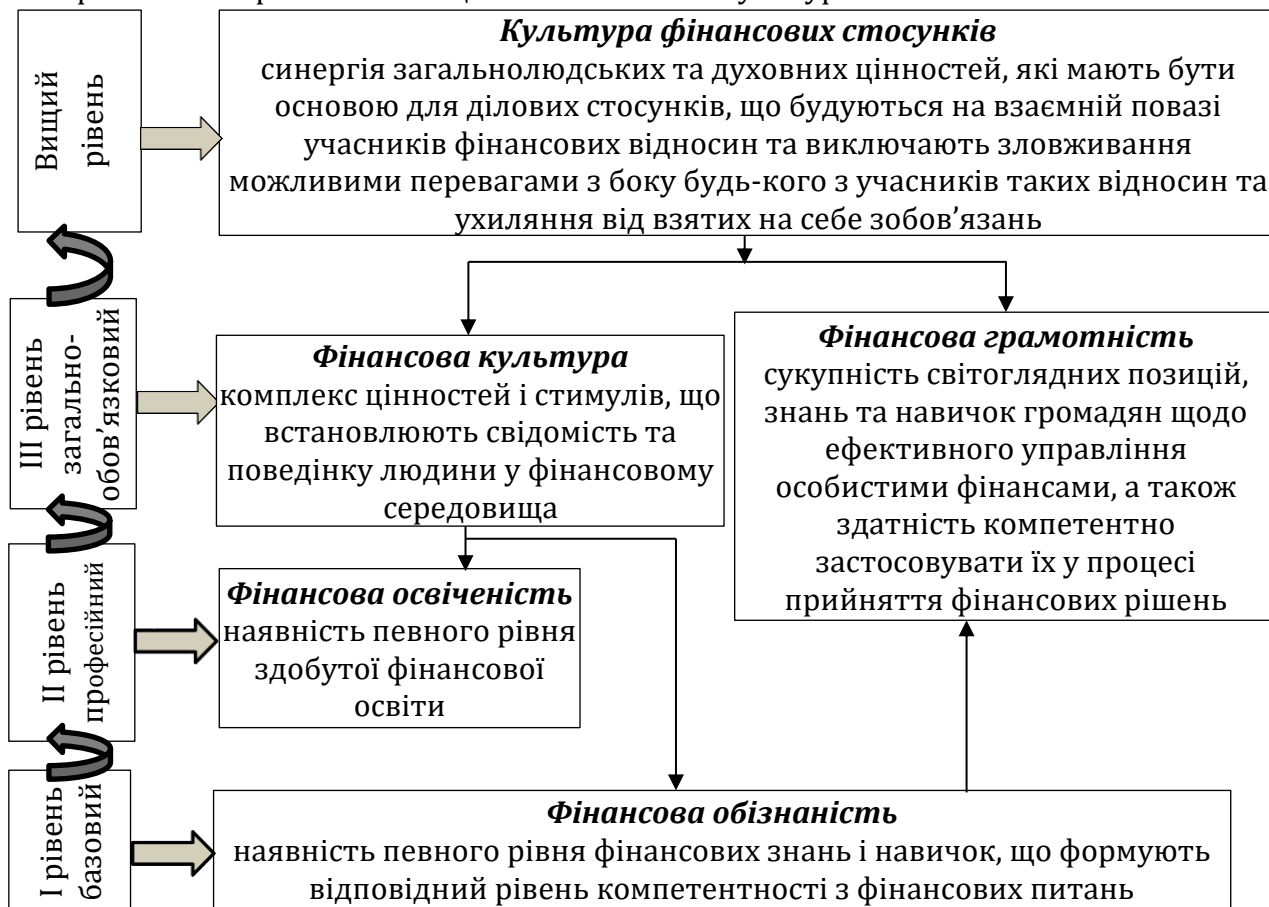
Рис. 2. Ієрархічна структура та визначення основних елементів культури фінансових стосунків

- оновлення соціально-економічних цінностей, норм через вироблення нових і використання перспективних цінностей з інших культур.