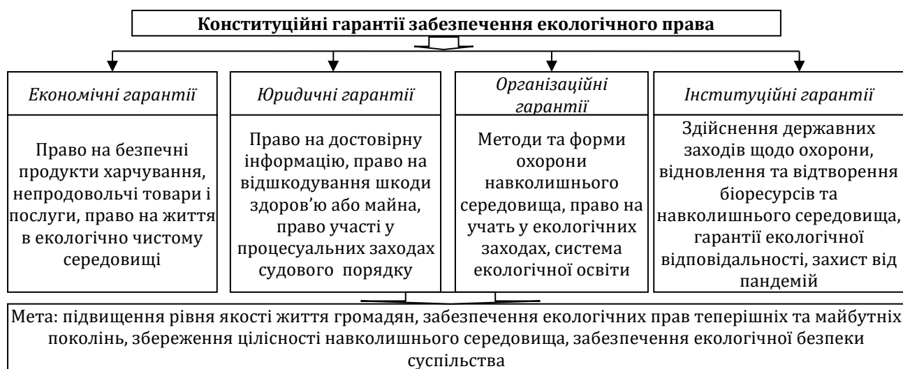
Рис. 1. Гарантії реалізації екологічних прав громадянина та суспільства

Організаційні гарантії екологічного права людини об'єднують заходи, методи та форми охорони навколишнього середовища, відновлення біо- та природних ресурсів, що здійснюються інституційними органами та публічними організаціями на різних рівнях господарського управління. З огляду на зміст та специфіку засобів забезпечення реалізації екологічного права у суспільстві вважаємо доцільним доповнити систему гарантій групою інституційних гарантій (рис. 1).