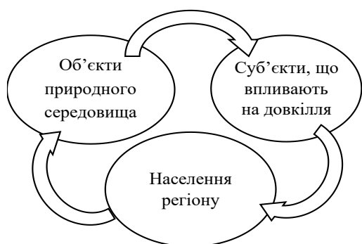
Рис. 3. Взаємодія елементів екологічної системи між собою

місцевому рівнях. Елементи екологічної системи взаємодіють між собою, відображаючись у масовій свідомості» (рис. 3.) [6, с. 84].