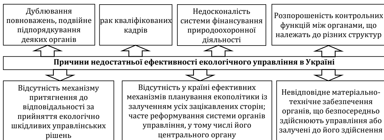
Рис. 2. Основні причини недостатньої ефективності екологічного управління в Україні (джерело: [6, с. 194])