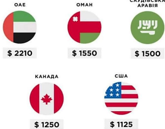
Рис. 2. Туристична статистика України за 2021 р.