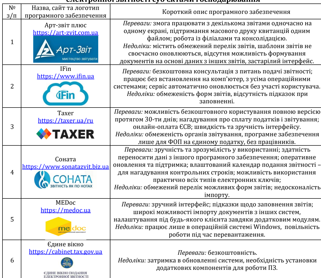
Таблиця 1. Порівняльна характеристика програмного забезпечення для задачі електронної звітності суб'єктами господарювання