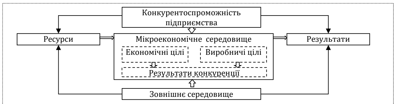
Рис. 3. Модель функціонування конкурентоспроможності на підприємстві

Запропонована модель функціонування конкурентоспроможності на підприємстві формує мультикомпонентну систему цілеспрямованої взаємодії між елементами, які впливають на конкурентоспроможність суб'єкта господарювання.