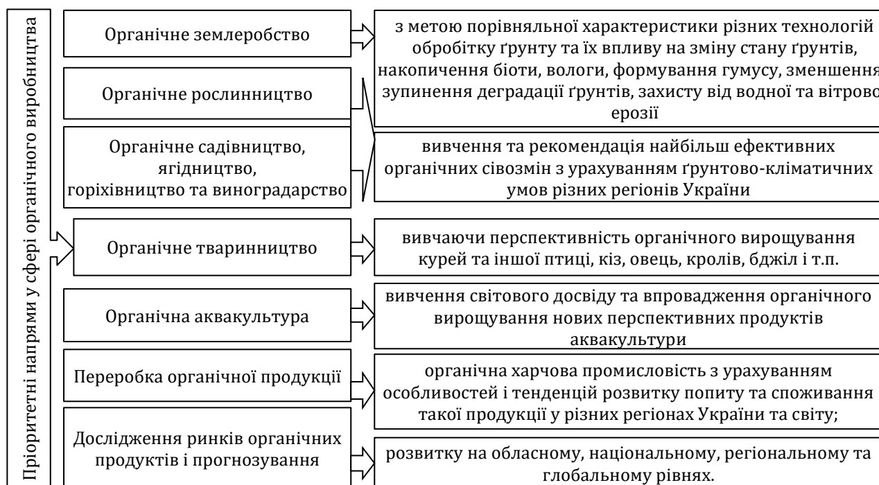
Рис. 2. Пріоритетні напрями дослідження у сфері органічної продукції

визначені дослідження дозволяють сформувати удосконалений комплекс органічного виробництва, що здатний задовольнити потенційного споживача та конкурувати на міжнародному ринку.