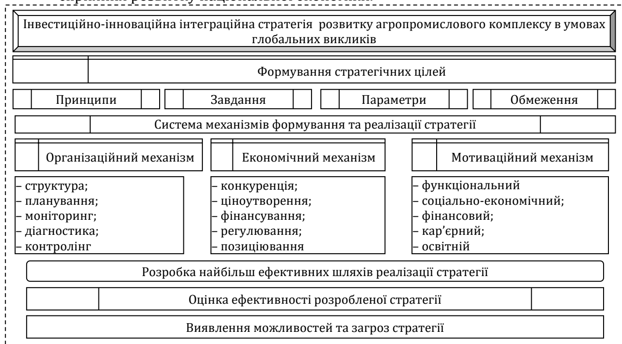
Рис. 4. Процес формування інвестиційно-інноваційної інтеграційної стратегії розвитку агропромислового комплексу в умовах глобальних викликів

Професор Ю. М. Мельник відзначав: «у процесі конкретизації інноваційно-інвестиційної інтеграційної стратегії забезпечується внутрішня та зовнішня синхронізація дій у часі. Внутрішня синхронізація стратегії передбачає узгодження в часі реалізації окремих напрямків інноваційного, інвестиційного та інтеграційного процесів між собою, а також формуванням необхідного забезпечення. Зовнішня синхронізація стратегії передбачає узгодження у часі реалізації інноваційно-інвестиційної інтеграційної стратегії зі стратегією розвитку суб'єкта, а також з прогнозованими змінами кон'юнктури макроекономічного середовища» [1].