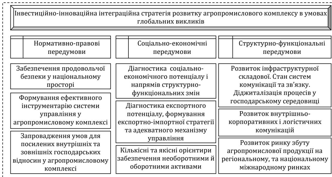
Рис. 1. Умови формування інвестиційно-інноваційної інтеграційної стратегії розвитку агропромислового комплексу в умовах глобальних викликів

значення у господарській діяльності агропромислового комплексу та його інфраструктурної складової.