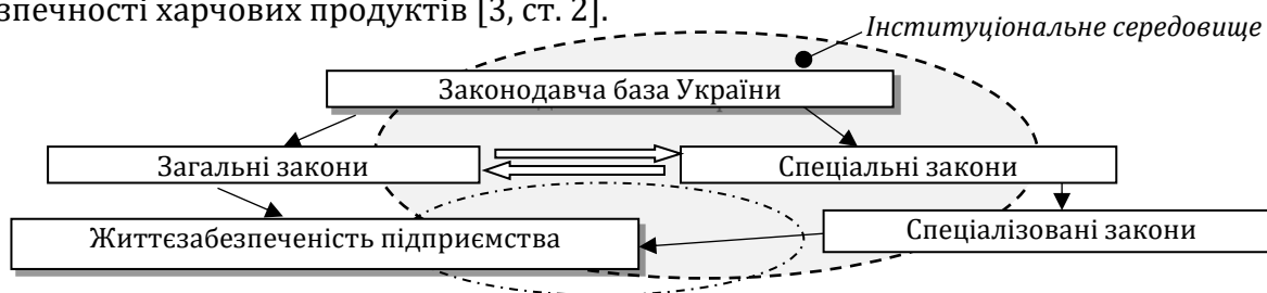
Рис. 1. Законодавча база регулювання управління життєзабезпеченням підприємств харчової промисловості України (розроблено автором)

Важливими актами загального законодавства в регулюванні питань управління життєзабезпеченістю підприємств харчової промисловості є: Господарський кодекс України, який упорядковує правові основи господарювання в сучасних ринкових відносинах в Україні, забезпечує ріст ділової активності суб'єктів господарювання, сприяє розвитку підприємництва у сфері харчової промисловості тощо [2]. Закон України «Про стандартизацію», який регламентує відносини, пов'язані з діяльністю у сфері стандартизації та застосуванням її результатів. У харчовій промисловості його застосування насамперед стосується до сфери якості харчових продуктів, проте необхідно зауважити, що дія даного Закону не поширюється на санітарні заходи безпечності харчових продуктів [3, ст. 2].