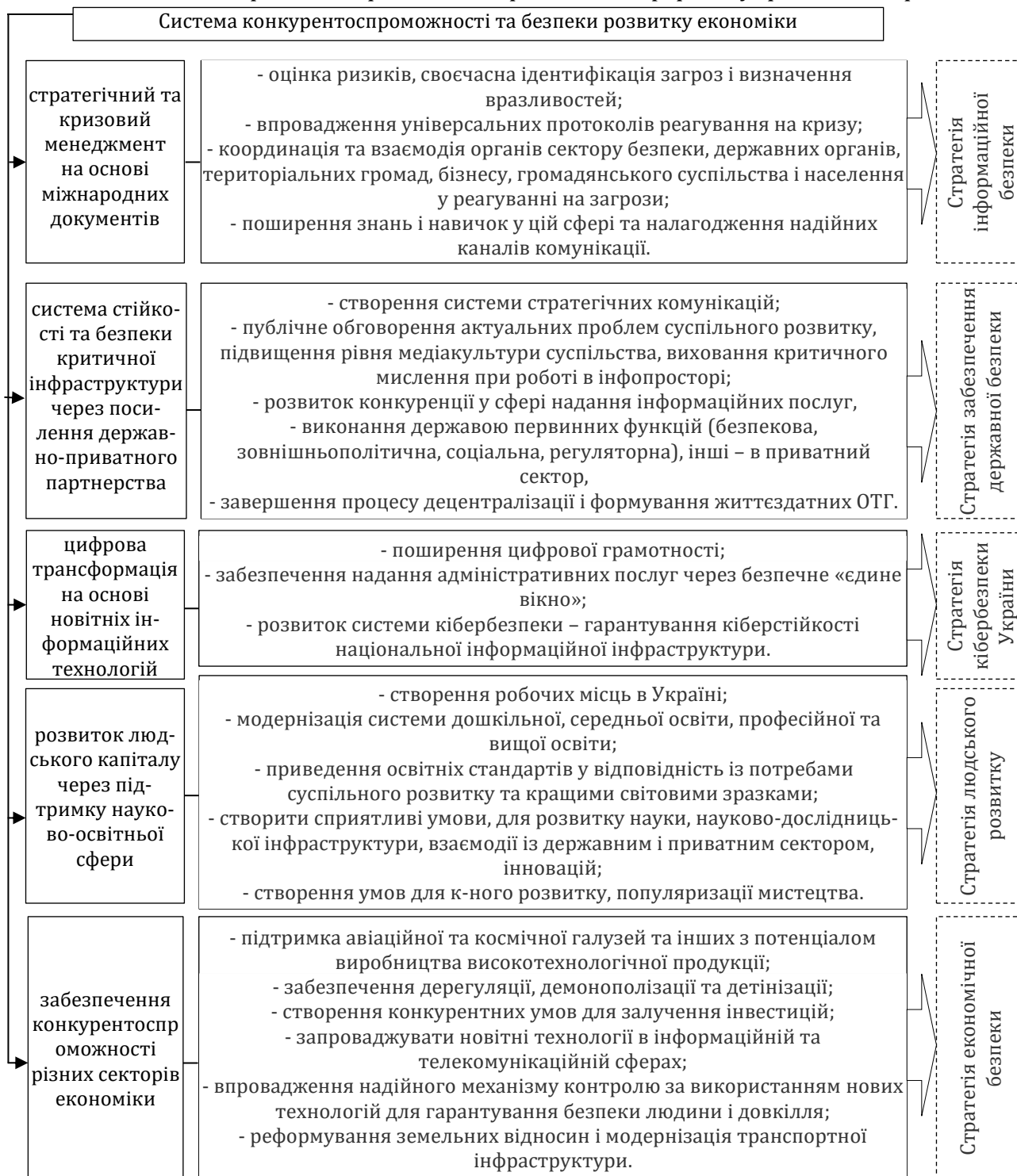
Рис. 1. Система зміцнення конкурентоспроможності та безпеки розвитку економіки з потенційними стратегічними документами

документів на основі Стратегії (зокрема, стратегії економічної безпеки, Стратегії людського розвитку тощо). Опрацювання ключових документів «Вектори економічного розвитку 2030» та Стратегії національної безпеки України «Безпека людини – безпека країни» стало підставою для розробки моделі посилення конкурентоспроможності та безпеки розвитку з прив'язкою до підстав для формування подальших стратегічних документів. Така модель (рис. 1) підкреслює основні напрями зміцнення безпеки, зацентровані в обох документах, та виводить передумови для підготовки наступних важливих системних рішень за різними напрямками та сферами управління державою.