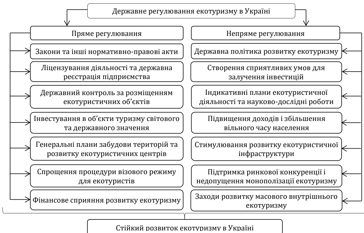
Рис. 2. Важелі державного впливу на екотуристичну дестинацію в Україні

розподіл кількості туристів протягом року, а отже, зменшити тиск на навколишнє середовище та підвищити стабільність доходів, хоча існує багато різних способів збирання туристичного екологічного податку.