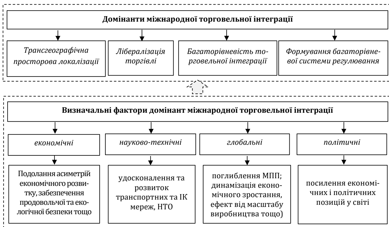
Рис. 1 Домінанти міжнародної торговельної інтеграції та їх визначальні фактори

Серед ключових домінант міжнародної торгівлі доцільно виокремити: трансгеографічну просторову локалізацію, лібералізацію торгівлі, багаторівневість торговельної інтеграції, формування багаторівневої системи регулювання (рис. 1).