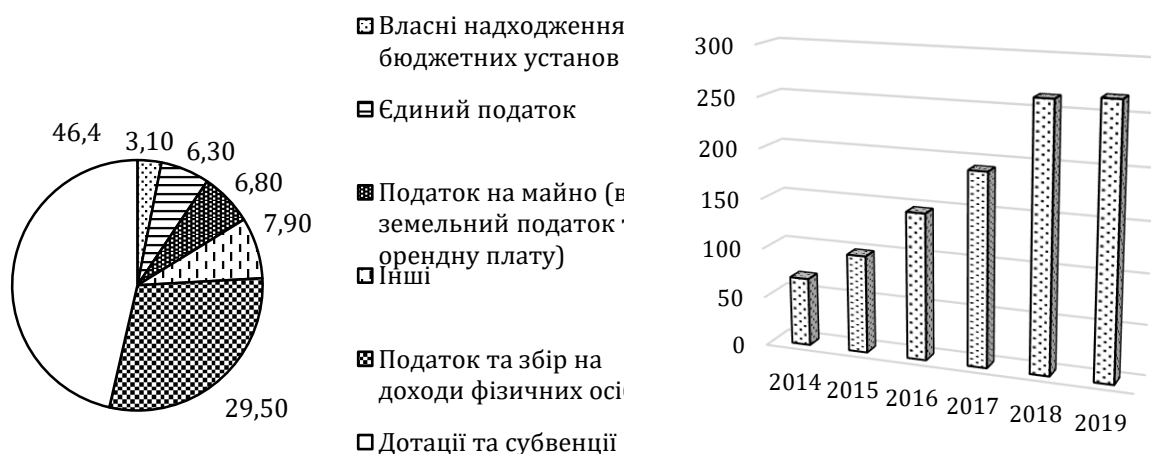
а) Структура бюджетоутворюючих доходів, 2019 рік, %

Структуру доходів місцевих бюджетів та динаміку власних ресурсів відображено на рис.2. Податок і збір на доходи фізичних осіб залишається основним бюджетоутворюючим джерелом. Ті громади, які мають зареєстрованих фізичних осіб-підприємців, отримують більші фінансові можливості територіального розвитку. Розуміння головних бюджетоутворюючих ресурсів надає змогу органам місцевого самоврядування стимулювати ті чи інші сфери підприємницької діяльності. Окрім позитивної динаміки зростання власних ресурсів місцевих бюджетів, яка в умовах загострення бюджетної кризи дещо уповільнилась у 2018-2019 роках, слід враховувати міжгромадівську диференціацію за цим показником. Аналіз власних доходів об'єднаних територіальних громад в Україні у розрахунку на одного мешканця показав значні розриви (станом на 2019 рік) [19]: