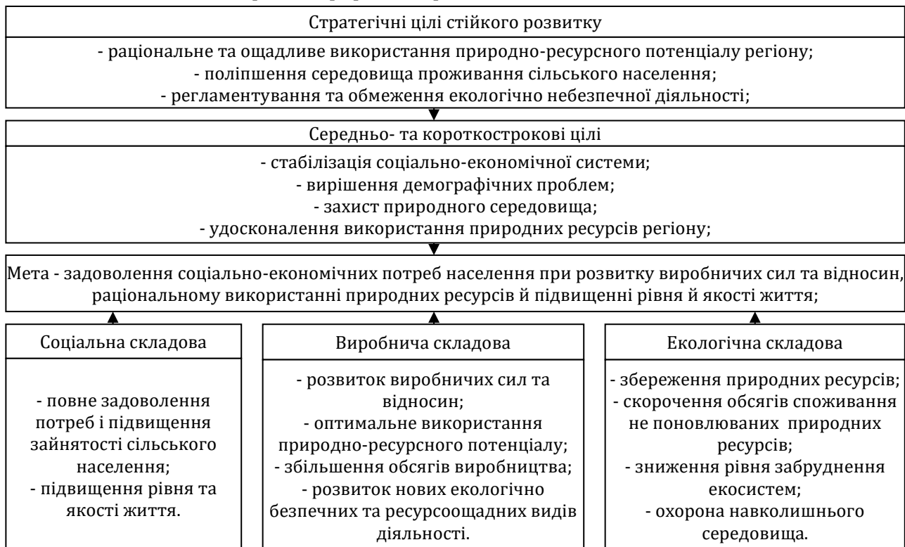
Рис. 1. Концептуальна модель формування конкурентних переваг агросфери регіону

Ключовими умовами й чинниками, що сприяють формуванню конкурентних переваг агросфери регіону є такі: