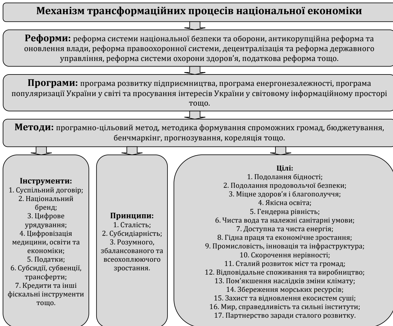
Рис. 3. Механізм трансформаційних процесів національної економіки

У контексті програмно-цільового підходу та дизайн менеджменту під економічним механізмом трансформаційних процесів національної економіки слід розуміти взаємоузгоджені дії влади, громади та бізнесу спрямовані на досягнення цілей сталого розвитку шляхом здійснення реформ інституційного, нормативно-правового й бюджетного характеру та реалізації державних програм розвитку з використанням сучасних програмно-цільових методів та інструментів (суспільний договір, цифрове урядування, цифровізація освіти, медицини та економіки, субсидії, субвенції, трансферти, кредити та інші фіскальні інструменти, національний бренд), із залученням представників громадськості та бізнесу до процесів державного управління.