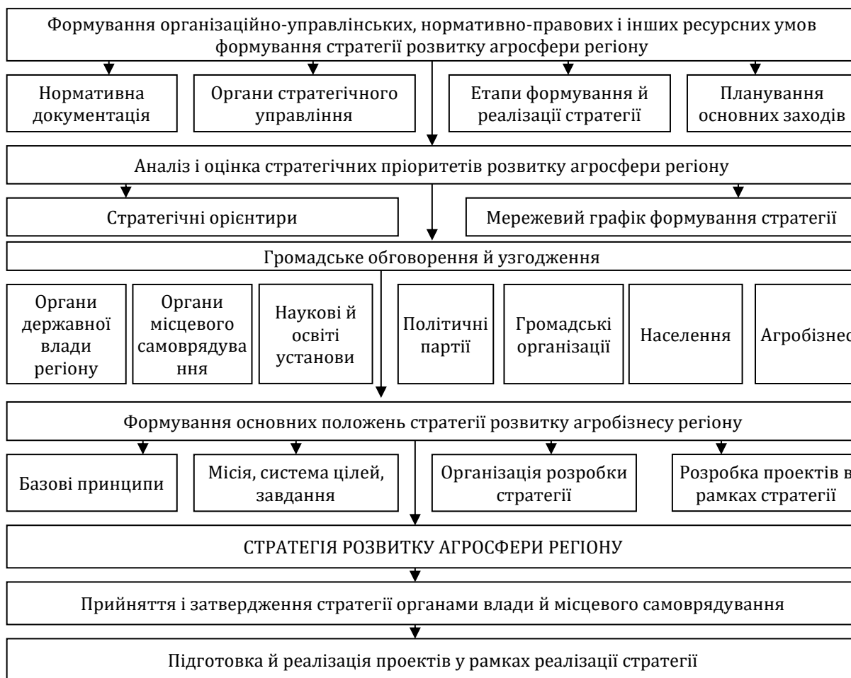
Рис. 3. Загальна схема процесу формування стратегії розвитку агросфери регіону

дозволяє на основі взаємозалежних цілей визначити стратегічні орієнтири й механізми розвитку агросфери, сільських територій, адміністративного району, регіону, узгодити регіональні стратегії із національною стратегією соціально-економічного розвитку України. Це дасть змогу визначити, які цілі досягаються й якою мірою, у яких сферах потрібне додаткове ресурсне забезпечення, а де відчувається надлишок ресурсів.