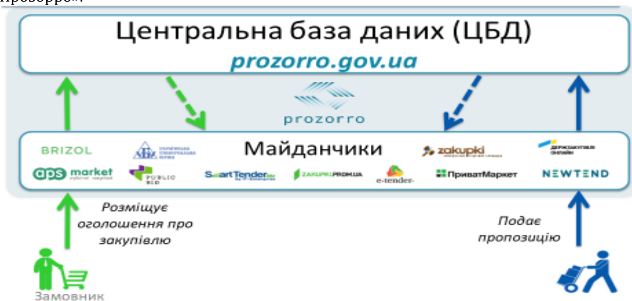
Рис. 3. Функціонування електронної системи ProZorro

В Україні, електронна система закупівель ProZorro являє собою механізм (рис. 3), що складається з державної центральної бази даних ЦБД, де проходять транзакції та зберігається вся інформація, та приватних/державних майданчиків, що надають доступ кінцевим користувачам. Адміністратором системи ProZorro є Державне підприємство «Прозорро».