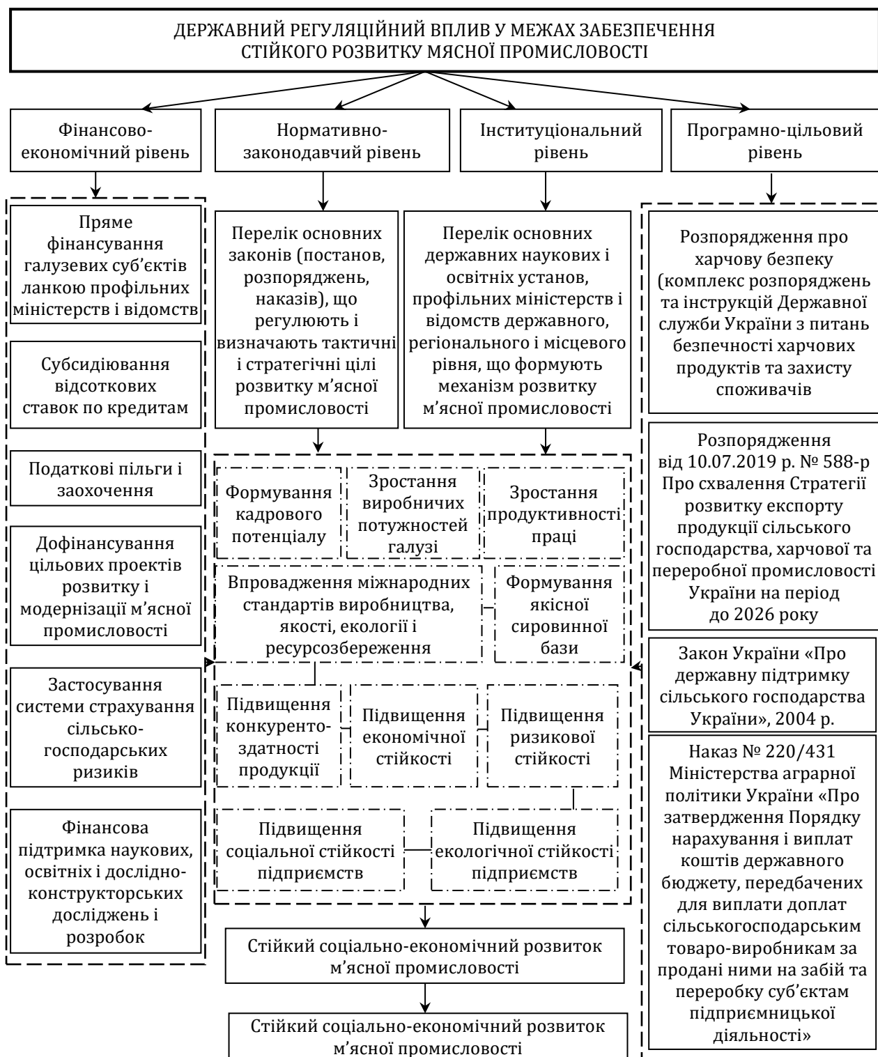
Рис. 1. Механізм державного регуляційного впливу у межах забезпечення стійкого розвитку м'ясопереробної промисловості [розроблено автором]

Беремося стверджувати, що вдало організована державна стратегія забезпечення стійкого розвитку м'ясопереробного сектору української економіки передбачає виконання низки системних напрямків реалізації (рис. 2).