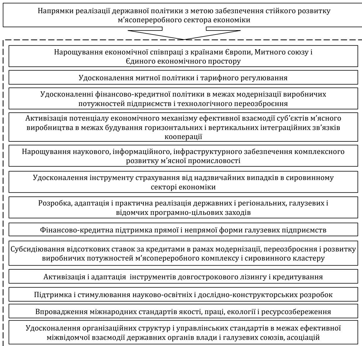
Рис. 2. Напрямки реалізації державної політики з метою забезпечення стійкого розвитку м'ясопереробної промисловості [розроблено автором]

м'ясопродуктів, можна виділити як внутрішні, так і зовнішні суб'єктивні причини. Когерентно вони обумовлюють підприємницькі ризики у м'ясному секторі економіки, збільшують прямі та опосередковані витрати, створюють складні адміністративні перешкоди і, як наслідок, культивують у галузі несприятливий інвестиційний клімат.