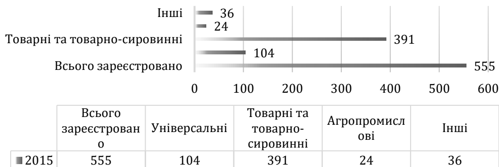
Рис. 2. Структура бірж за спеціалізацією у 2015 році [4]

Така кількість бірж України значно перевищує кількість бірж у країнах ЄС та у США. Однак, перевага України в кількості бірж не впливає та не є взагалі свідомим показником розвитку та впливу біржового ринку на економіку країни та на підвищення ефективності їхньої діяльності в цілому.