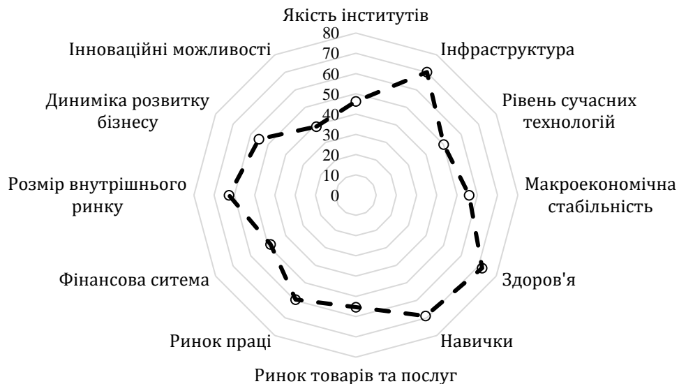
Рис. 2. Індекс глобальної конкурентоспроможності України за 2018 рік.

Спираючись на звіт глобальної конкурентоспроможності, можна відокремити перелік факторів, що негативно впливають на ведення бізнесу в країні. Оцінки цих факторів здійснювалась опитуванням респондентів Всесвітнього економічного форуму. Їм було запропоновано перелік факторів (табл. 1) та запропоновано обрати п'ять найбільш проблемних факторів для ведення бізнесу у своїй країні та проранжувати їх між 1 (найбільш проблематичним) і 5 (найменш проблематичними).