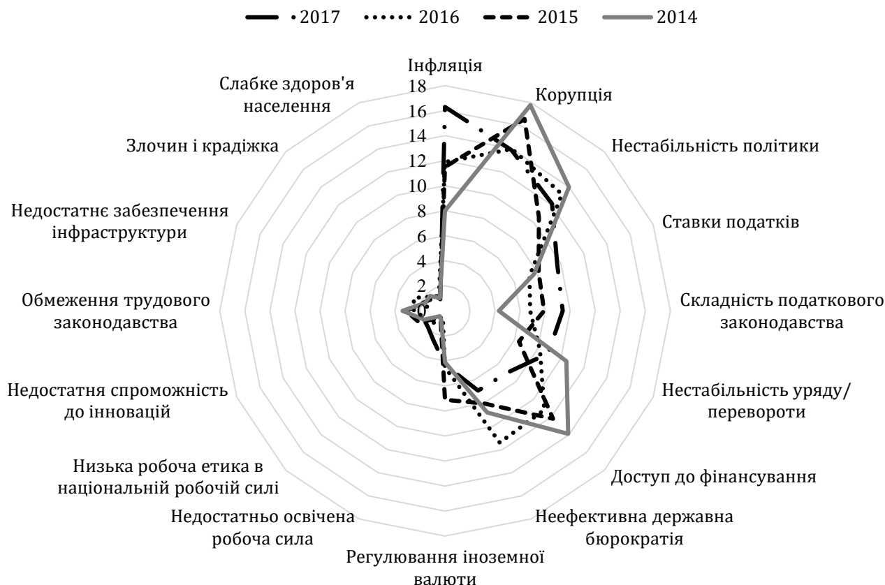
Рис. 3. Динаміка факторів негативного впливу на ведення бізнесу в Україні за 2014-2017 рр.